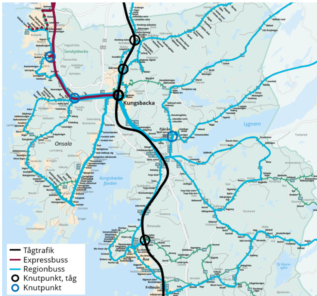
Figur 2. Översikt av framtaget trafikeringsförslag, ett scenario med ny expressbusslinje till Kungsbacka.

Det starka stråket mellan Fjärås och Kungsbacka förstärks med en robust busslinje med högt utbud mellan dessa orter. Flera busslinjer föreslås mötas vid Fjärås centrum, vilket utvecklas till en viktig knutpunkt i systemet.